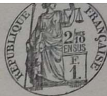
TABLE DÉCENNALE des actes de Décès de la commune de S t André de Bulzac du 1 er Janvier 1903 au 31 Décembre 1912, dressée en exécution du Décret du 27 Février 1913 (1903 à 1912).