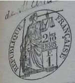
TABLE DÉCENNALE des actes de Décès de la commune de St André de Bulzac du 1 er Janvier 1903 au 31 Décembre 1912, dressée en exécution du Décret du 27 Février 1913 (1903 à 1912).