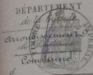
TABLE DÉCENNALE des actes de Naissance de la commune de S t . André de Cubzac du 1 er Janvier 1853 au 31 Décembre 1862 dressée en exécution du décret du 20 Juillet 1807 (1853 à 1862)