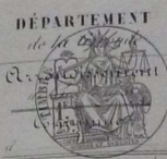
TABLE DÉCENNALE des actes de Naissances

de la commune de St. André de Cubzac, du 1 er Janvier 1845 au 31 Décembre 1852 dressée en exécution du décret du 20 Juillet 1847 (1845 et 1852)