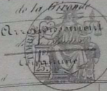
TABLE DÉCENNALE des actes de Naissance

de la commune de Frères de Cujac , du 1 er Janvier 1845 au 31 Décembre 1852 dressée en exécution du décret du 20 Juillet 1847 (1845 à 1852)