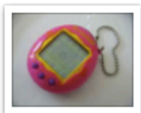
Tomasz Sienicki .jpeg