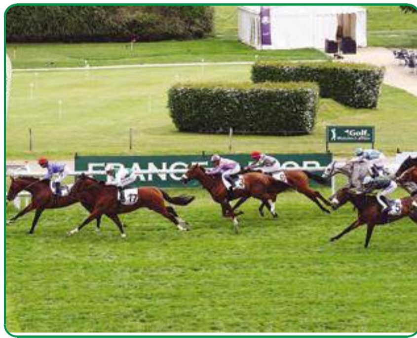
Après deux courses de rentrée, My Sweet Lord n'a pas tardé à passer le poteau en tête.

La note : Chill Wind , 7e à 11/1 Monté sagement en queue de peloton, il a fourni un plaisant effort final, laissant une belle impression. La déception : Dagobert Duke , 10e à 79/10 Toujours remarqué parmi les derniers, il n'a jamais pu se rapprocher utilement. ■A.A.