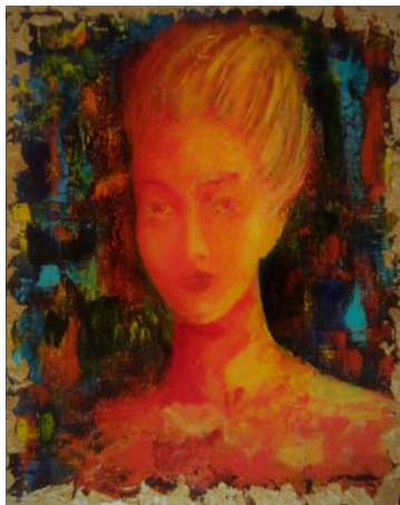
Gabrielle de nos jours par Josy Moreau Peter

Un diaporama sur les favorites royales qu'il est impossible techniquement de montrer au Café de Flore sera présenté lors de notre Assemblée Générale le mercredi 14 juin à la Mairie du 7ème arrondissement