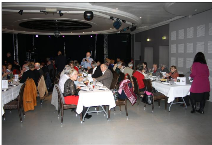
Tous les amis (es) ont trouvés leur place, ou presque. (L'éclairage est faible pour mes photos).