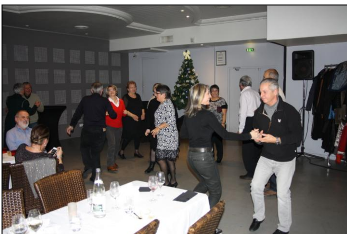
Vers 17h, lorsque j'ai quitté la fête l'ambiance était à son comble.