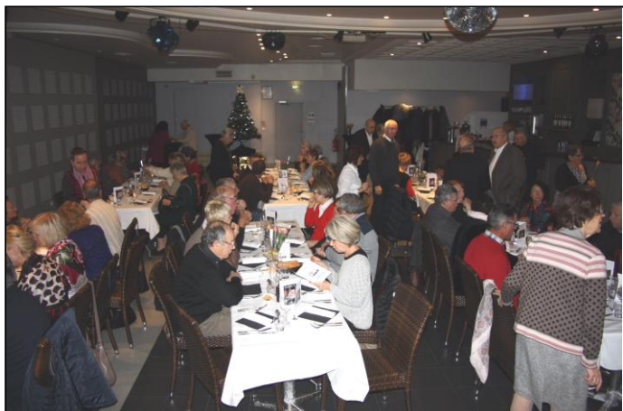
Pendant le repas, les groupes d'amis n'ont pas arrêtés de discuter, de blaguer...et de se faire remarquer.