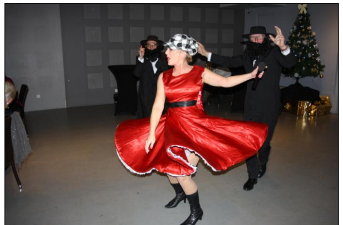
Odile a « accroché » deux de nos amis dont je ne donnerai pas les noms, qui ont, après une petite hésitation, enflammés la scène.