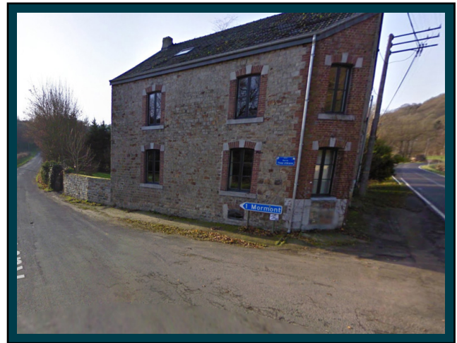
Prenez la première à gauche vers "Mormont". Take the first left towards "Mormont".