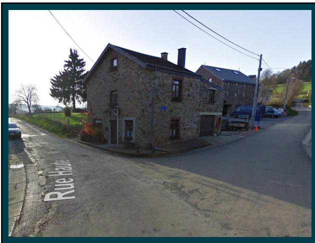
Traversez "Mormont" en montant la route principale, prenez à gauche au Y sur la photo. Drive through "Mormont" climbing the main road, take left at the Y pictured above.