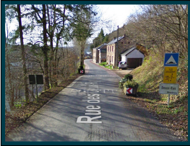
Traversez "Deux-Rys". Drive through "Deux-Rys".