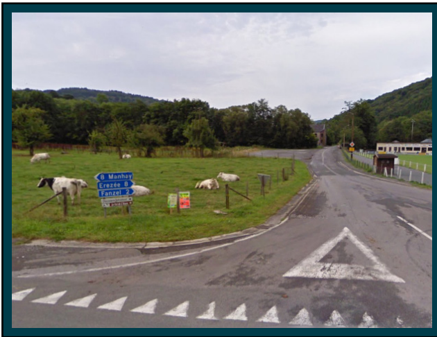
Au carrefour, traversez la route vers "Erezée" "Fanzel". Attention à droite en traversant, la vision est limitée. At the crossroad, cross over the main road towards "Erezée" "Fanzel". Watch out, the vision on the right is limited.