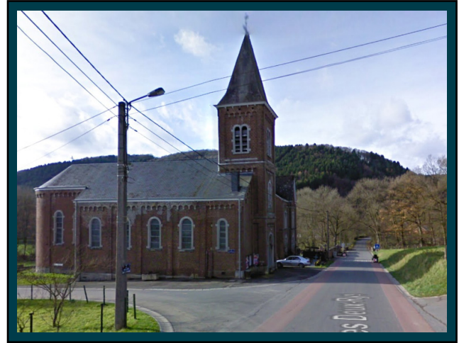
Avant l'église, prenez à gauche. Right before the church, take left.