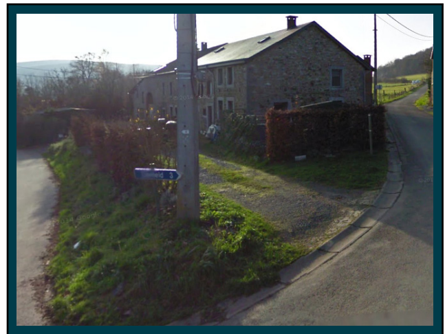
Au Y suivant, prenez à droite direction "Clerheid". At the next Y, take right towards "Clerheid".