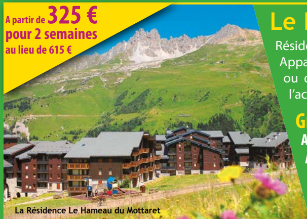
La Résidence Le Hameau du Mottaret

A partir de 325 € pour 2 semaines au lieu de 615 €