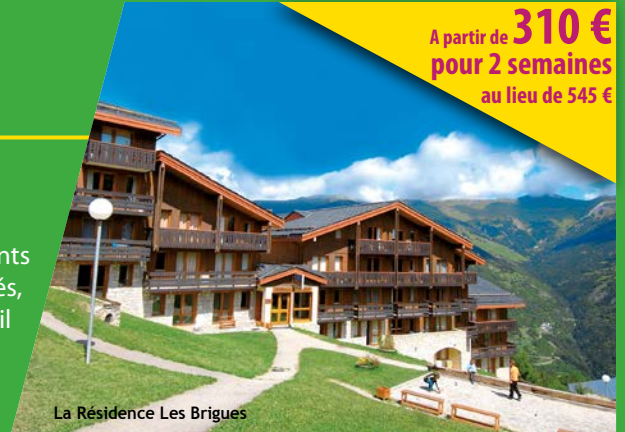
La Résidence Les Brigues

Résidence s'articulant autour de 2 grands chalets communicants. Appartements équipés : kitchenette (micro-ondes, lave-vaisselle), salle de bains, WC séparés, télévision gratuite, balcon ou accès direct sur l'extérieur. Accès wifi à l'accueil (gratuit).