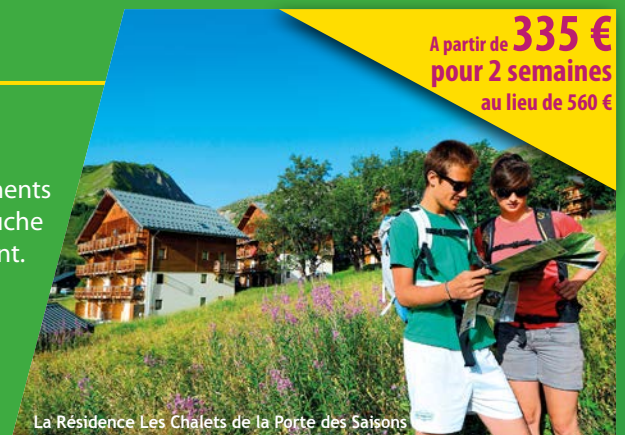
La Résidence Les Chalets de la Porte des Saisons

A partir de 335 € pour 2 semaines au lieu de 560 €