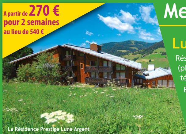
La Résidence Prestige Lune Argent

A partir de 270 € pour 2 semaines au lieu de 540 €