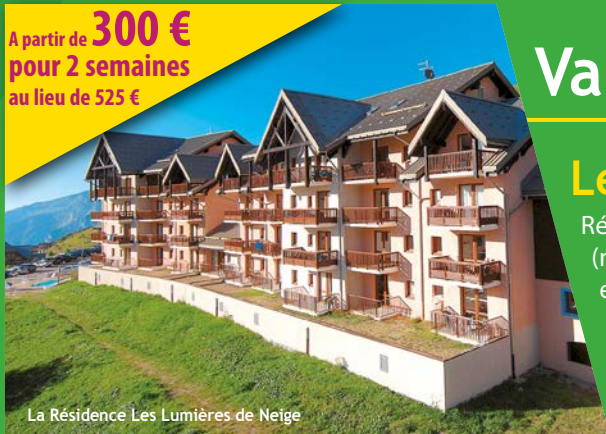
La Résidence Les Lumières de Neige

A partir de 300 € pour 2 semaines au lieu de 525 €