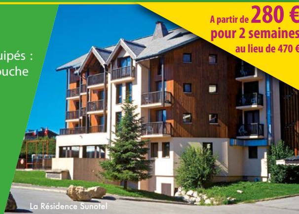
La Résidence Sunotel

Randonnée avec accompagnateur (2 demi-journées par séjour)