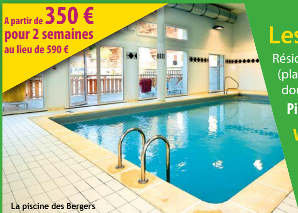
La piscine des Bergers

A partir de 350 € pour 2 semaines au lieu de 590 €