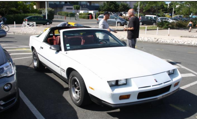
CHEVROLET Camaro 3ème génération (1982-1992).