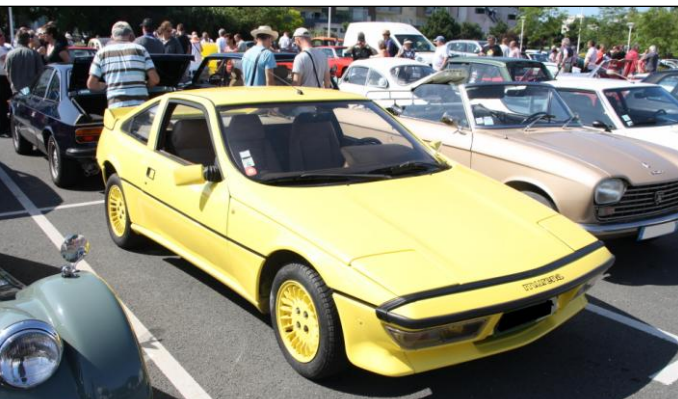
TALBOT MATRA MURENA (1981-1983)