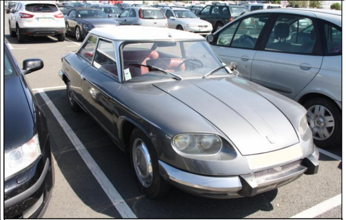
PANHARD 24 bt (1965-1967).