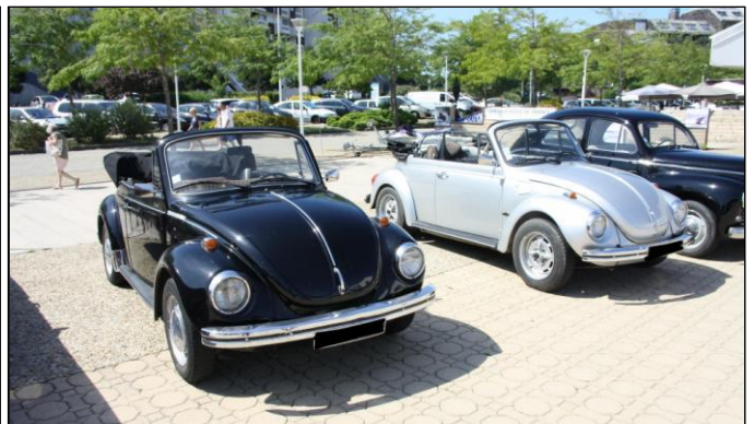
2 VOLKSWAGEN COCCINELLE 1303 L