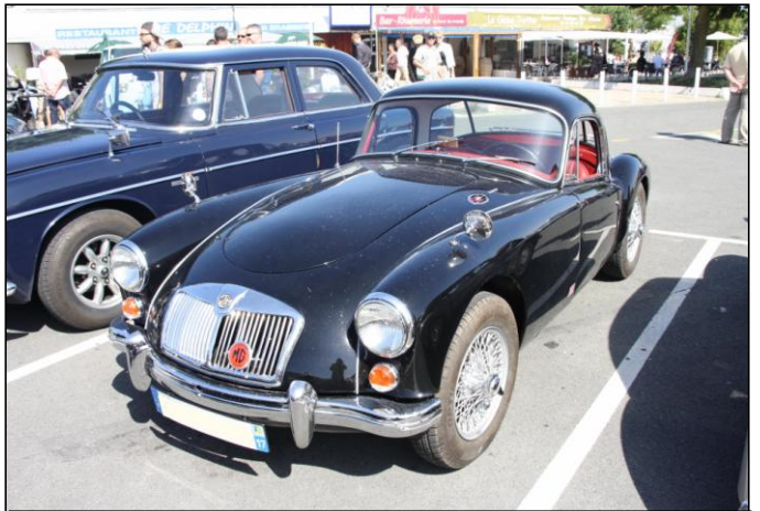
MG A coupé (1955-1962).