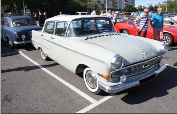
OPEL Kapitän de 1961.