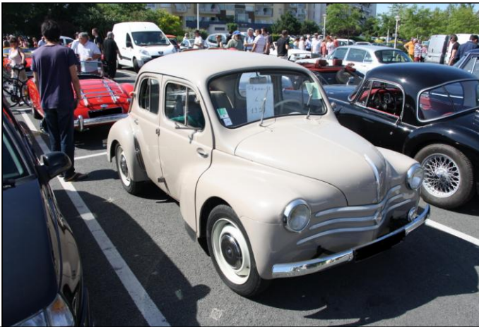
RENAULT 4 cv de 1957.