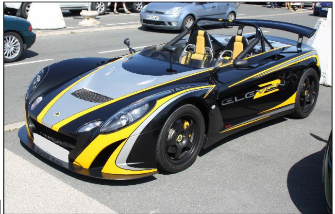
LOTUS 2-Eleven (2007-2008).