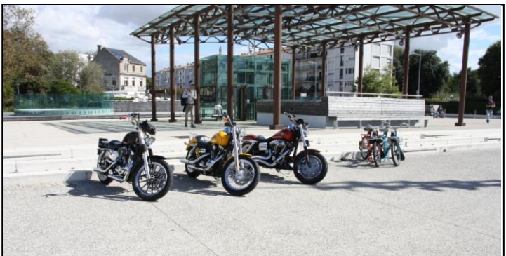
Un petit aperçu des 2 roues.....