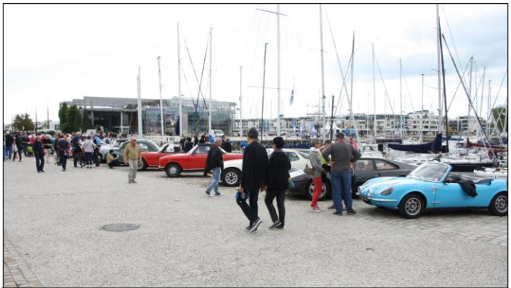
...c’est un peu « nu », mais qu’importe, les visiteurs sont là, pas très nombreux mais très intéressés.