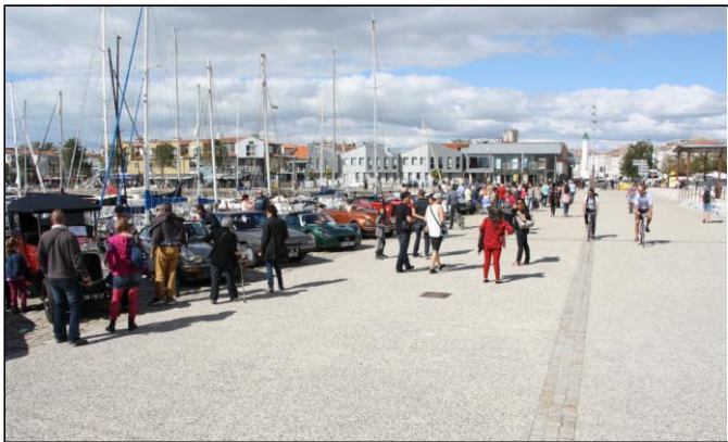
En bordure du quai, nous n’aurons que 23 voitures, 4 Harley Davidson et 2 solex...