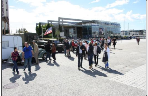
Du côté US Motors, nous n’aurons que 9 véhicules dont 2 jeeps et 1 GMC.