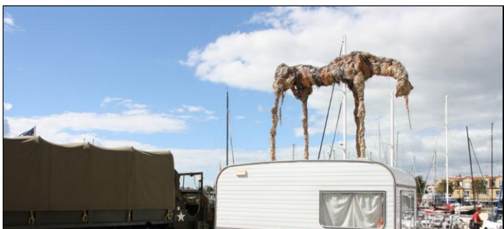
Plus loin, sur une caravane, une « licorne momifiée » était en exposition.