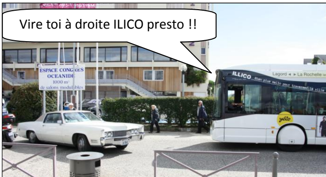
Un face à face musclé entre la Cadillac et le bus ILICO.