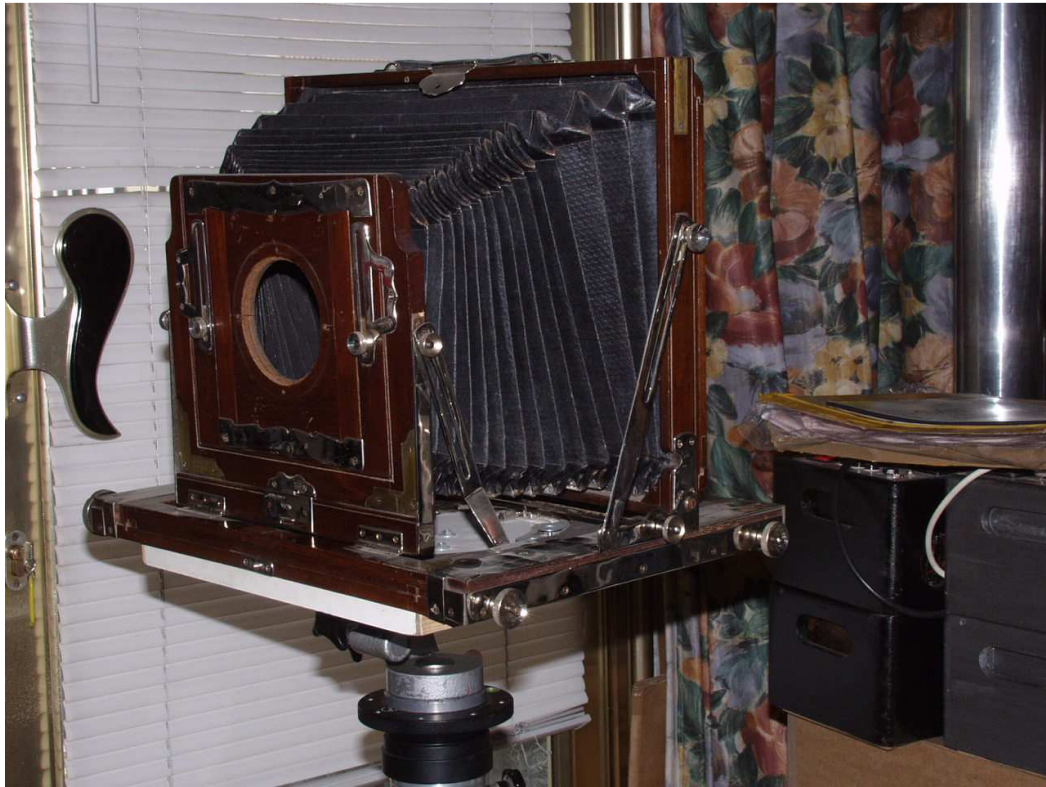
Vageeswari 8p x 15p – vue avant