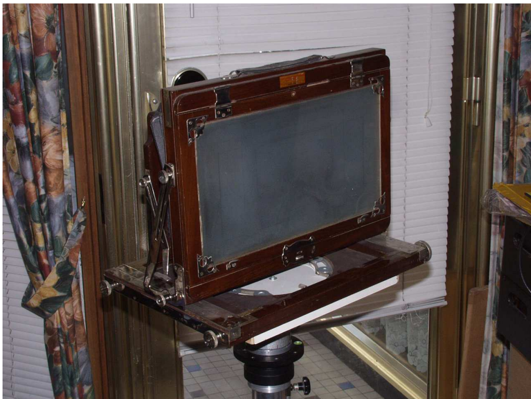
Idem vue arrière