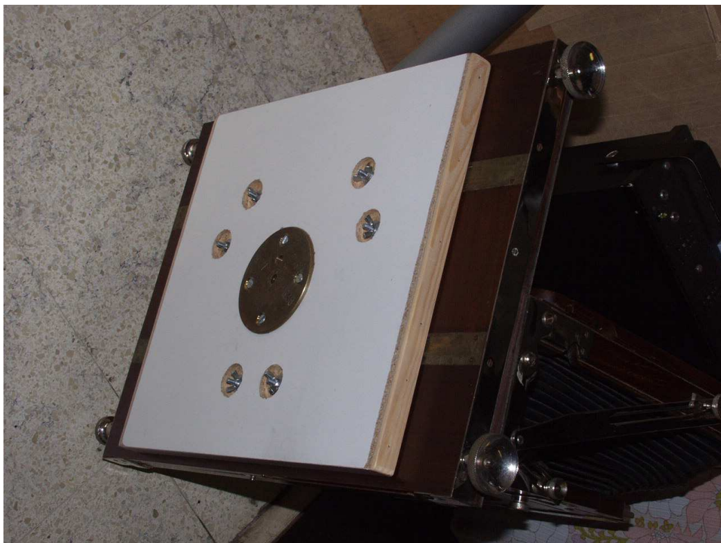
Fixation du nouveau support – vue dessous – centre = ancien obus dans lequel un trou 3/8p a été percé et taraudé à l'aide d'un taraud aux normes britanniques ... à remarquer les vis papillons