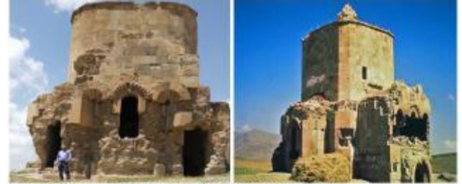
Kuzey-doğu ve güney-doğu cepheleer