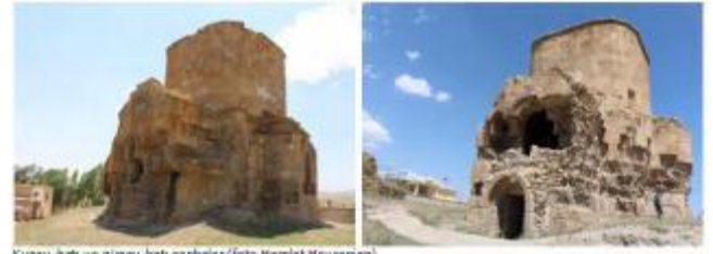
Kuzey-batı ve güney-batı cepheleer