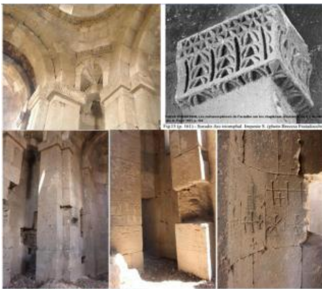
Էջ յառեմեաբ (ճօճառն) Patrick D'ONOFRI, Les mélanges de l'acrotère sur les chapiteaux arméniens du V e au VIIIe siècle, Paris 1993, p. 160

↑ - [19] Հ. Համազասպ Ոսկեան, Վասպուրական - Վանի վանքերը, Վիեննա: Մխիթարեան տպարան, 1947, էջ 806