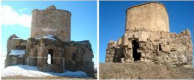
Kuzey ve güney cepheleer