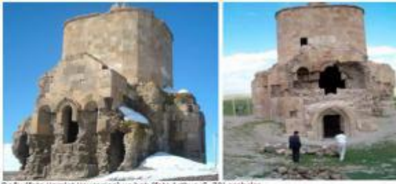
Doğu ve batı cepheleer