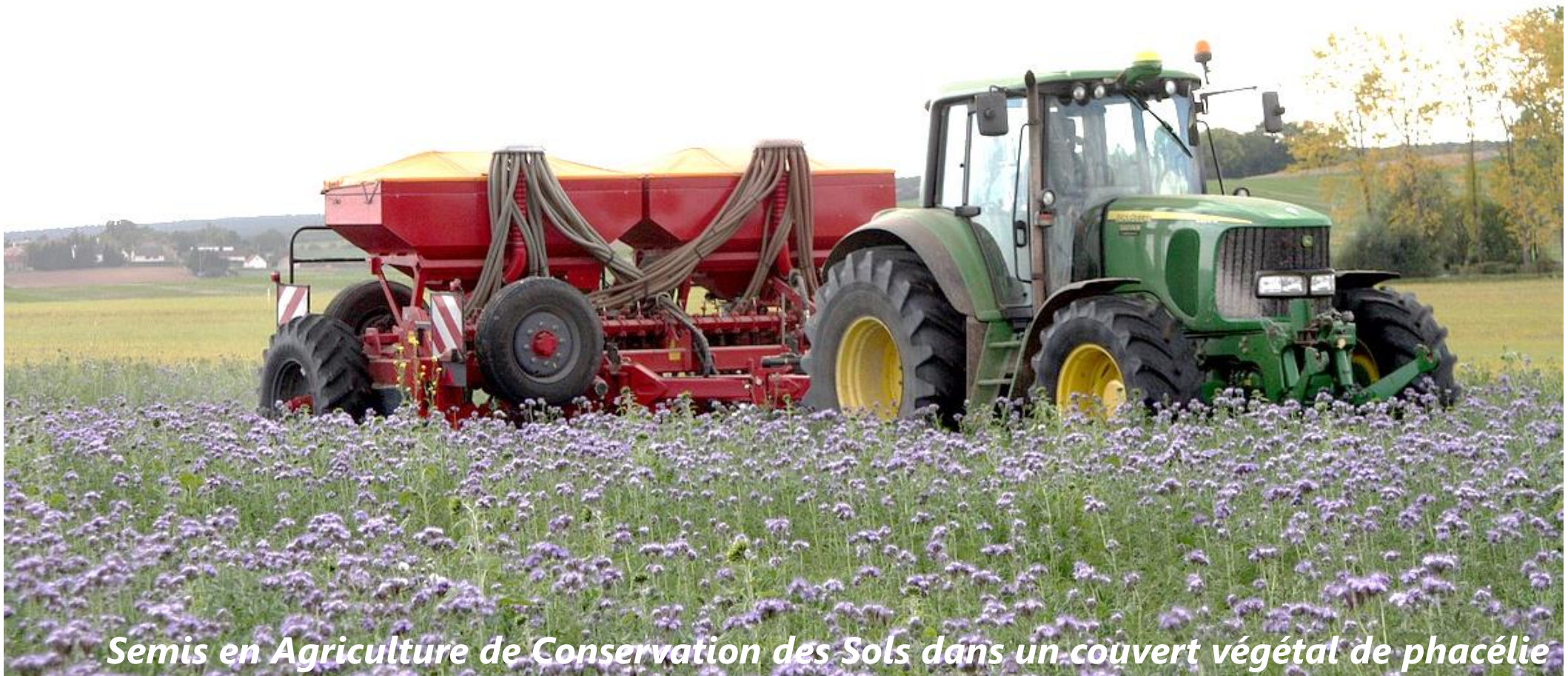
Semis en Agriculture de Conservation des Sols dans un couvert végétal de phacélie

L'agro-écologie près de chez vous : venez rencontrer des agriculteurs engagés dans l'agriculture de demain, l'Agriculture de Conservation des Sols