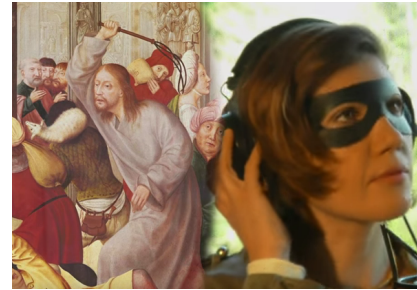
Le Christ chassant les marchands du Temple.

Il figure dans la galerie de portraits de la chanson « Le Retour des héros », aux côtés de dizaines de figures dont celle... du Christ, qui serait lui aussi un « frère humain mort en vain ».