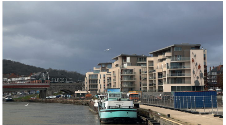
Le Port du Bon Dieu. Au moins 300 000 euros pour un deux chambres. Hors de prix pour la plupart des Namurois. Pourquoi pas s'inspirer du modèle viennois ?

La Ville de Namur risque d'écopier d'une amende de neuf cent mille euros sanctionnant le manque de logement public (9 % au lieu des 10 % réglementaires). L'explosion du logement privé de standing en est en partie la cause. Comme le manque d'ambition des pouvoirs publics en matière de... logement public. C'est un choix politique de la majorité, de laisser la main aux investisseurs privés pour construire des immeubles hors de prix malgré le besoin criant de logements au prix accessible. Namur pourrait s'inspirer de bons exemples européens comme Vienne, où la création de logements publics a permis de réguler les loyers et faciliter l'accès au logement pour un plus grand nombre.