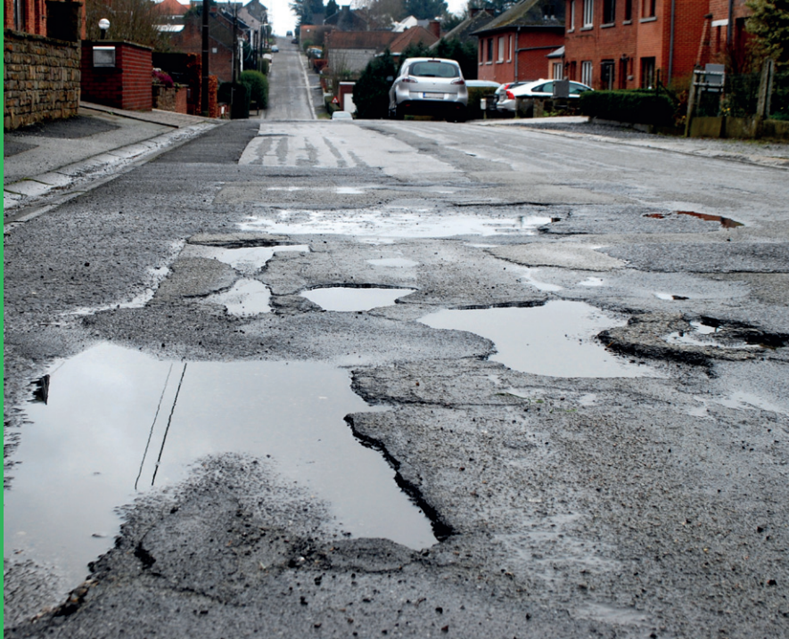
Les nids-de-poule sont nombreux dans les villages namurois. Pour le PTB, il est temps de partager le budget pour qu'il réponde aux besoins de chacun.