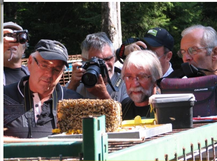
Les apiculteurs de France visitant la station de fécondation des reines de Carniole au coeur de la forêt vierge.