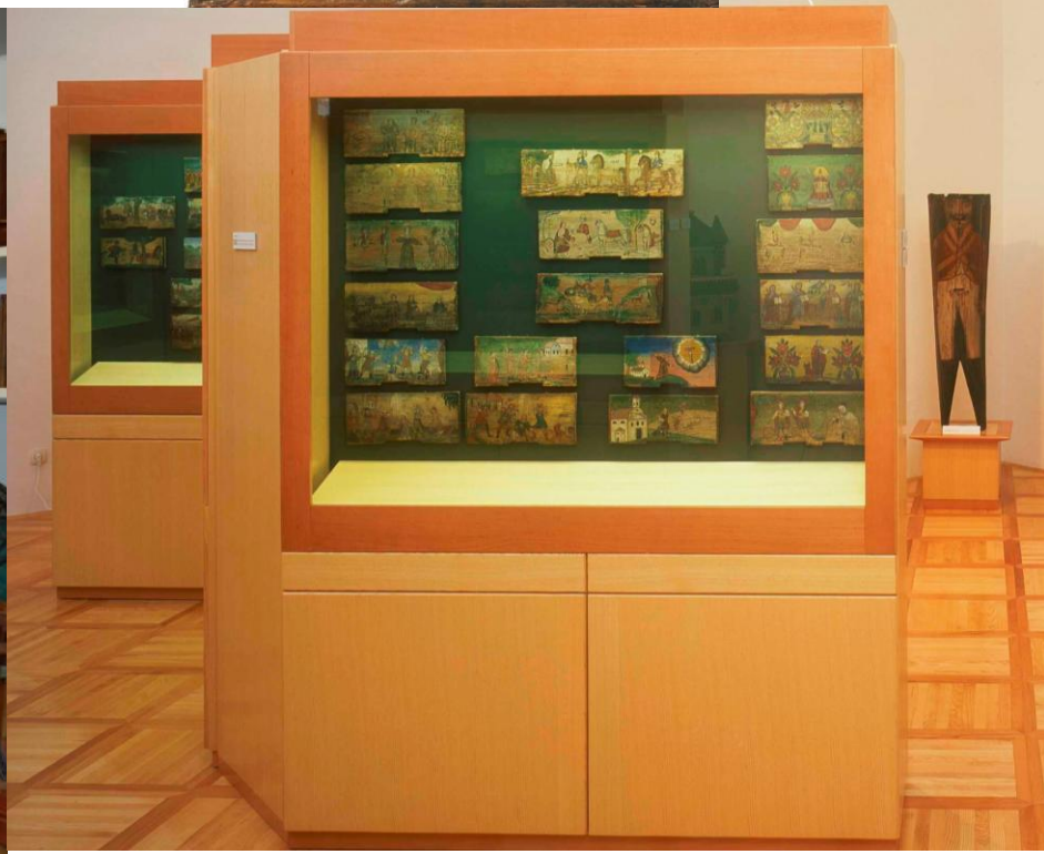
Musée de l'apiculture avec quelques 600 frontons de ruches peints