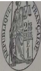
TABLE DÉCENNALE des actes de Décès

de la commune de St André de Bulzac du 1 er Janvier 1903 au 31 Décembre 1912, dressée en exécution du Décret du 27 Février 1913 (1903 à 1912).