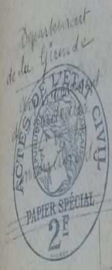
Table décennale des actes de Naissances de la commune de S t André de Cubzac du 1 er Janvier 1913 au 31 décembre 1922, dressée en exécution du décret du 27 février 1913 (1913 à 1922)