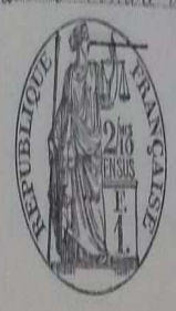
TABLE DÉCENNALE des actes de Naissances de la commune de d'André de Gulyac du 1 er Janvier 1903 au 31 Décembre 1912, dressée en exécution du Décret du 27 Février 1913 (1903 à 1912).