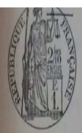
TABLE DÉCENNALE des actes de Naissances de la commune de S' Andre de Bulzac du 1 er Janvier 1903 au 31 Décembre 1912, dressée en exécution du Décret du 27 Février 1913 (1903 à 1912).