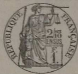
TABLE DÉCENNALE des actes de Naissance de la commune de S t André de Cubzac du 1 er Janvier 1903 au 31 Décembre 1912, dressée en exécution du Décret du 27 Février 1913 (1903 à 1912).