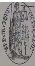
TABLE DÉCENNALE des actes de Naissances de la commune de St André de Cubzac du 1 er Janvier 1903 au 31 Décembre 1912, dressée en exécution du Décret du 27 Février 1913 (1903 à 1912).