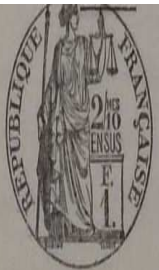
TABLE DÉCENNALE des actes de Naissances de la commune de Saint André de Cubzac du 1 er Janvier 1903 au 31 Décembre 1912, dressée en exécution du Décret du 27 Février 1913 (1903 à 1912).