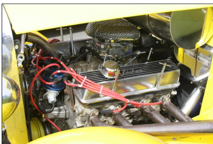
CITROEN C4 IX de 1932 customisé et son moteur V6.