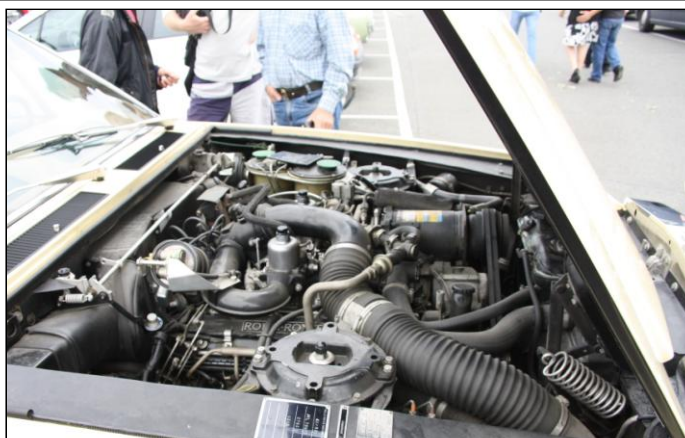
ROLLS-ROYCE Camargue de 1983 et son moteur V8 de 6,75 litres. Consommation : 30 L / 100km.