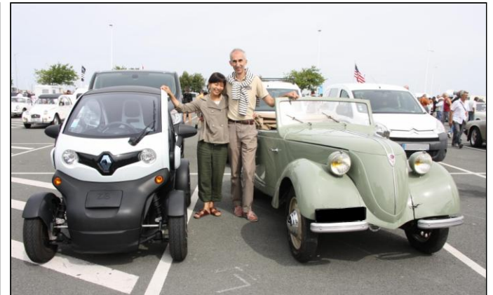
Un autre plaisir « électrique » après 75 ans.