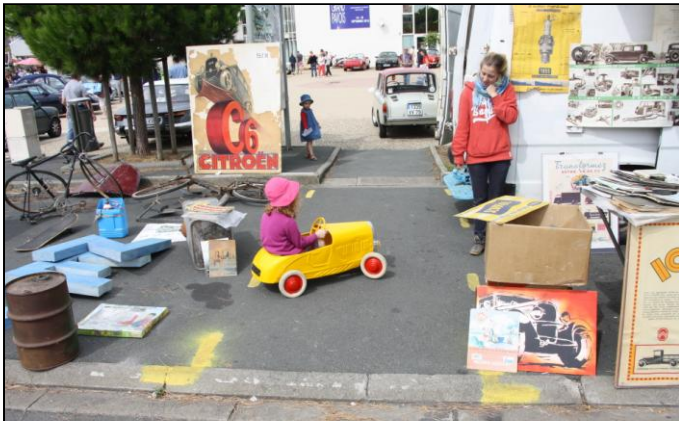
Une petite « puce » se fait un petit plaisir.