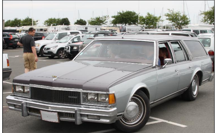
CHEVROLET Caprice Estate de 1977