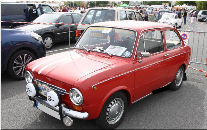
FIAT 850 Spécial de 1971.