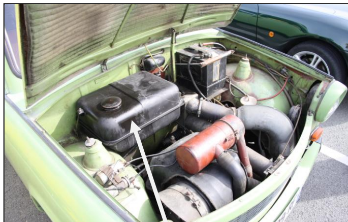
TRABANT 601 construite de 1963 à 1990 et son moteur 2cyl. 2temps. Réservoir de 26 litres.