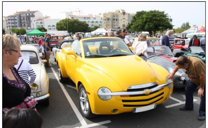
CHEVROLET SSR (2003-2006)