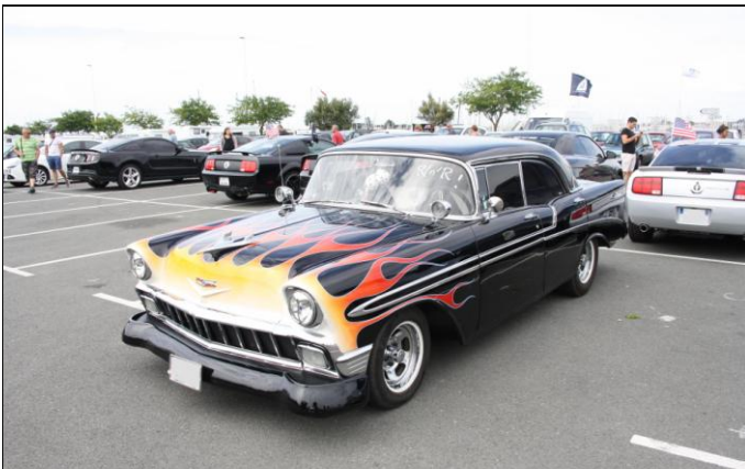
CHEVROLET Bel Air de 1956.