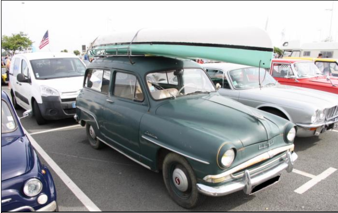
SIMCA Aronde Chatelaine 1300 (1956-1958).