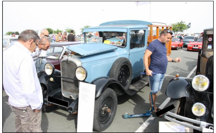
CITROEN C4 G plateau de 1931