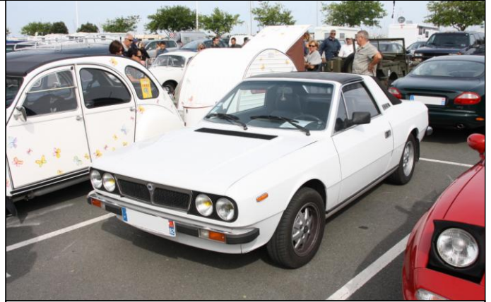
LANCIA Beta (1972-1984).