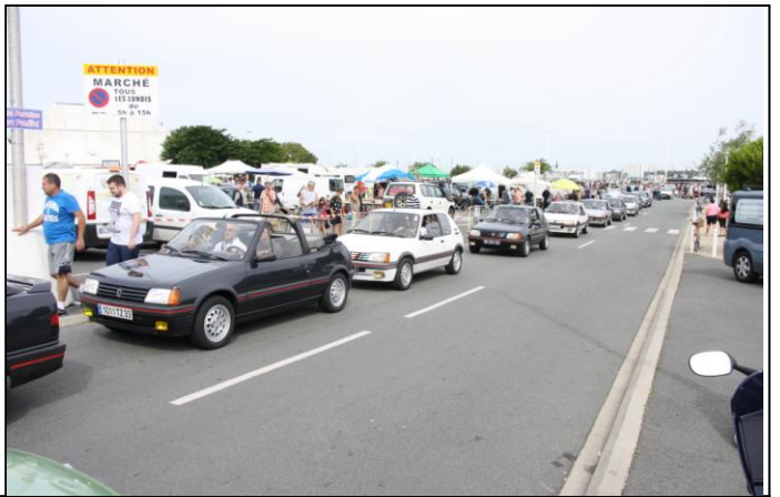
Vers 11h30, une petite idée de l'expo. Il est midi, c'est le départ des 205 (une bonne douzaine).