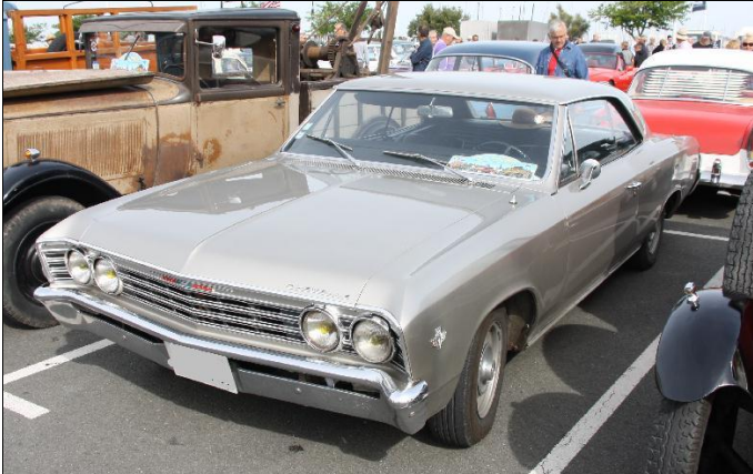
CHEVROLET Chevelle (1964-1967)