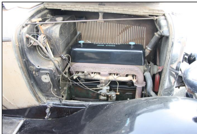
CITROEN C6F de 1930. Berline transformée en dépanneuse à l'époque...et son moteur.