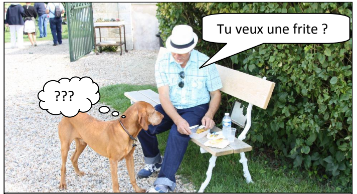
Notre ami a préféré se mettre à l'écart, mais il ne s'attendait pas à la visite du « maître des lieux ».