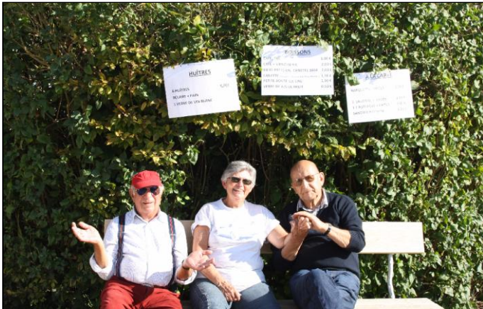
Nos amis se vendent-ils ? Et à quels prix ?