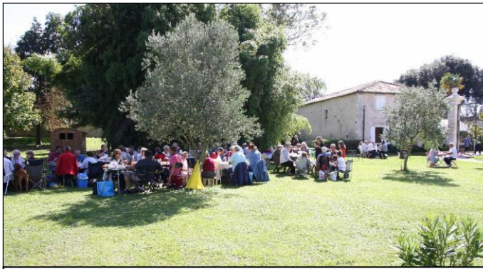
Dans le parc, c'est l'heure du pique-nique et de la détente sous une météo de rêve.