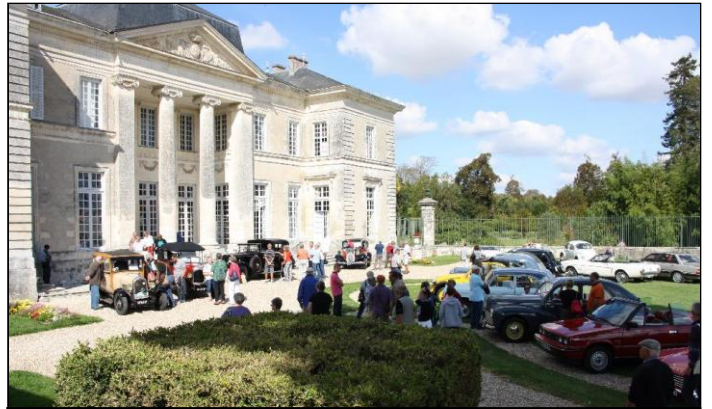
En milieu d'après-midi, nous avons une belle collection de véhicules mais trop peu de visiteurs.