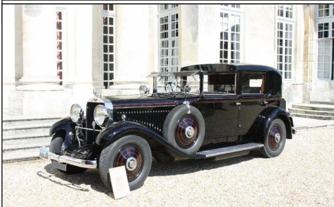
La reine du jour, l'HISPANO-SUIZA H6B coupé-chauffeur Binder de 1926.