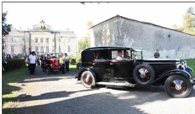
Enfin, c'est le départ. 18h, la journée se termine.