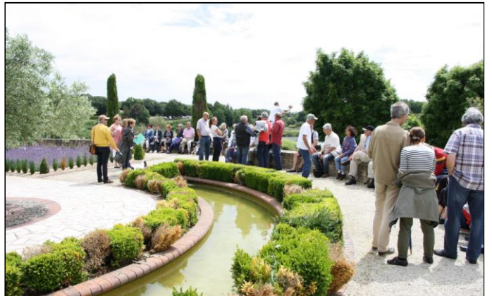
Une petite pause, au fond des jardins avec le lac en contrebas, avant de repartir. Il est 15h30 et il fait beau !