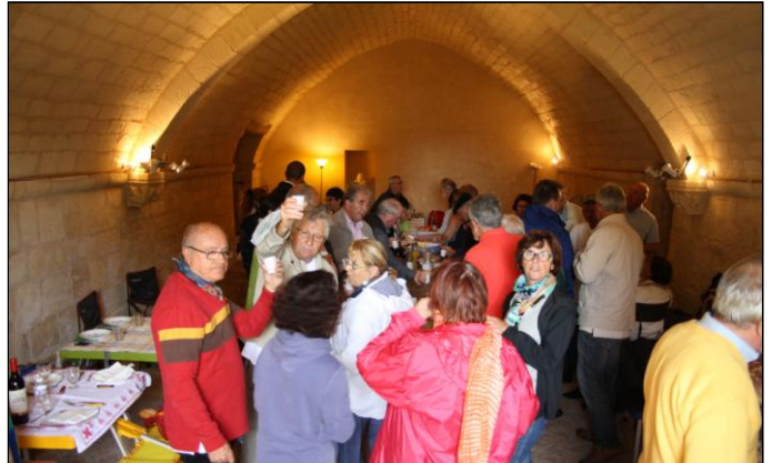
C'est l'heure du pique-nique, mais à l'abri. Nous entrons par une petite porte, dans une salle sans fenêtres mais très satisfaisante pour cette journée. Nous y prendrons l'apéro avant notre pique-nique personnel.