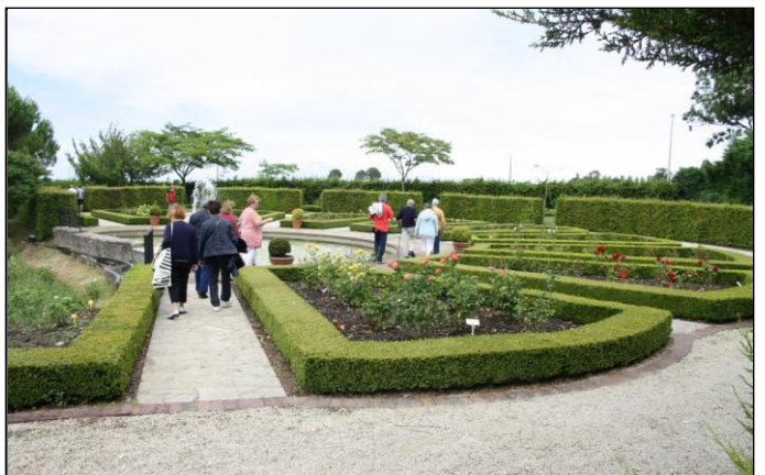
Nous sommes aux jardins de Compostelle sur les hauteurs du lac. Les jardins sont « à la française ». Les massifs et les bassins sont très beaux, de plus, une petite pancarte donne le nom des plantes.