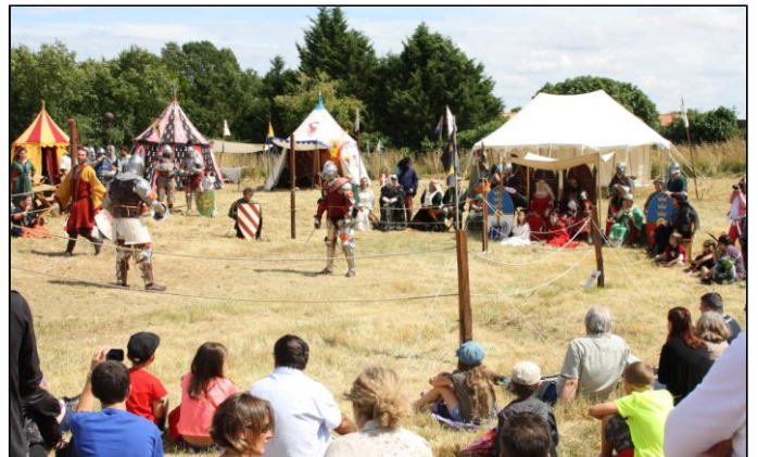
Sur la route de St AGNANT, nous faisons une halte à l'ancien prieuré de MONTIERNEUF. Un énorme pigeonier se trouve à l'entrée, puis derrière, la reconstitution d'un camp et de combats, en armures et avec des épées des plus réalistes. Je n'aurai pas aimé recevoir les coups d'épées, même sur une armure. Ils ne font pas semblant !