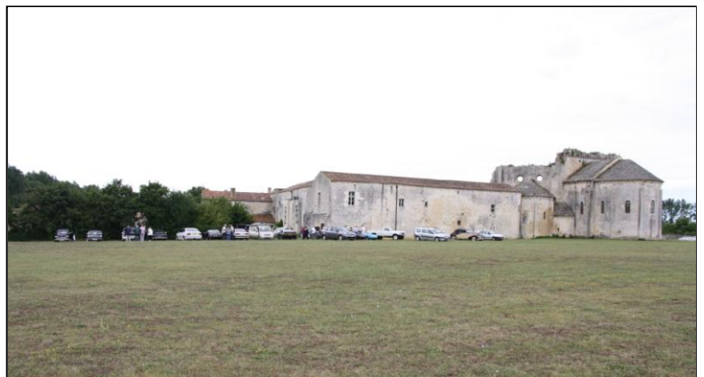
Vers 14h, certains se lâchent un peu. Un dernier coup d'œil sur l'abbaye avant de rejoindre le lac de TRIZAY.