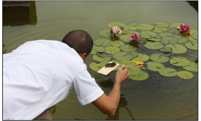
Au bord du bassin, un attroupement, un sauvetage improvisé s'organise pour sauver un petit être de l'eau. Un mulot se trouve sur une feuille de nénuphar et une âme charitable s'allonge pour attraper cette pauvre bête.