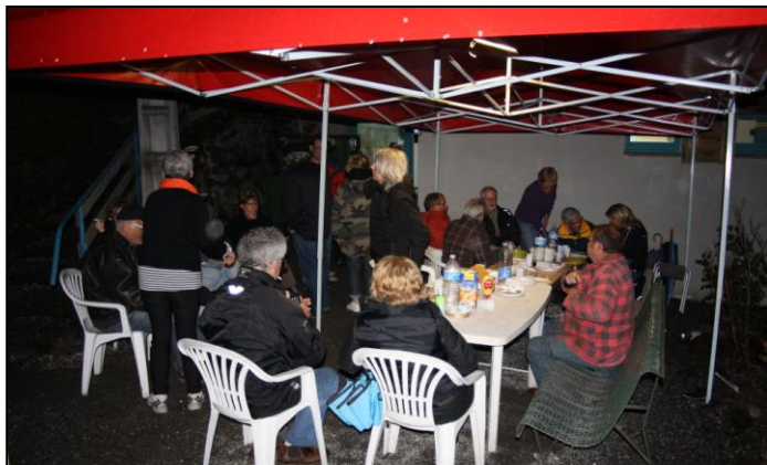
La pluie s'est calmée, mais pour se réchauffer, il faut être à plusieurs ou boire.