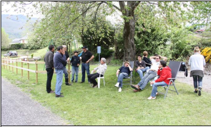
Après un bon repas, certains n'en peuvent plus.