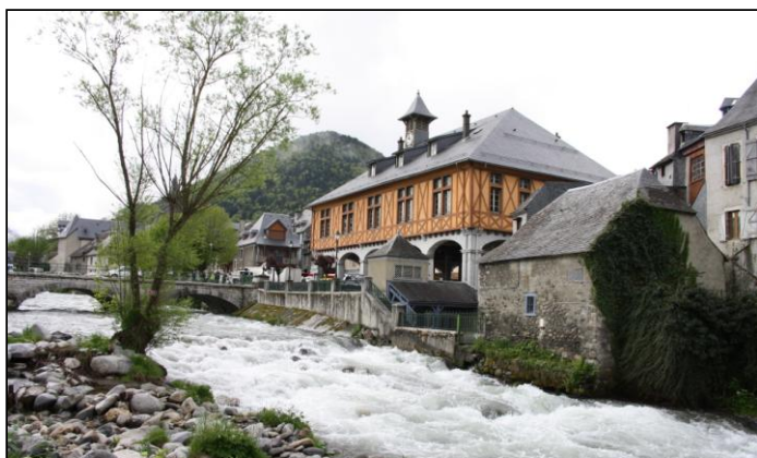
ARREAU ville d'eau, confluent de la Neste du Louron et de la Neste d'Aure. Sa mairie et son marché.