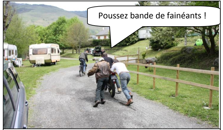
Un problème de carbu.