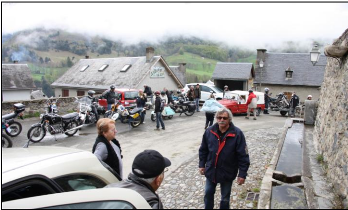
Pour profiter de l'air frais, petite halte sur la mini place d'AZET à 1100m d'altitude.