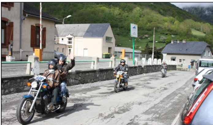
10h30, départ pour la 1 ère sortie. Ils ne tiennent plus. Comme on dit, « ils ont le feu au c... ».