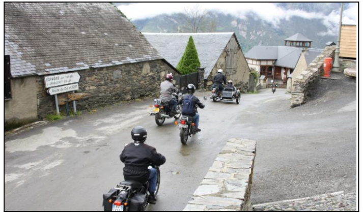
Demi-tour et retour vers ARREAU. Pourquoi monter une côte pour faire demi-tour 2mn plus tard ?