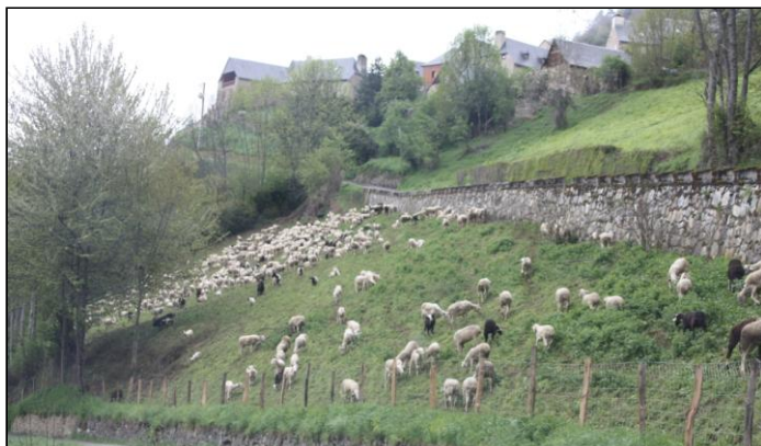
Sur la route d'AZET (161 hab. 6 hab. au km 2 ), encore des moutons entre GRAILHEN et CAMPARAN.