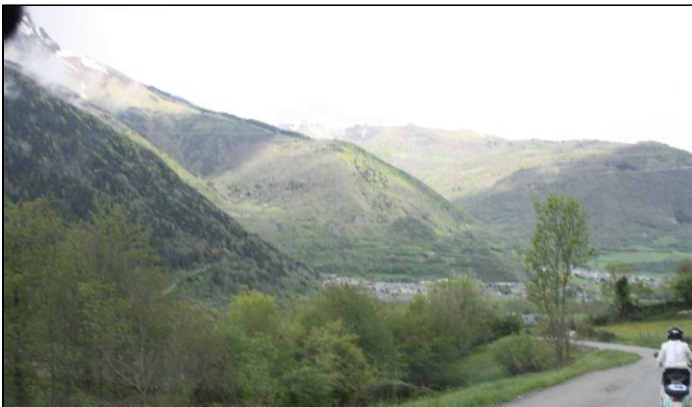
Dernière vue sur le Lambretta avant une impressionnante gamelle, heureusement, dans une zone relativement plate et droite.