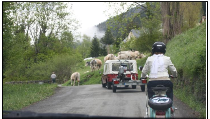
Pour changer, des vaches sur la route et en pleine côte. Françoise aura du mal à relancer son Lambretta.