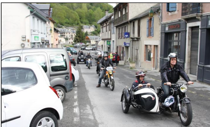
Jeudi 9 au matin, il y a marché à ARREAU. L'équipe chauffe les pneus avant la sortie prévue.