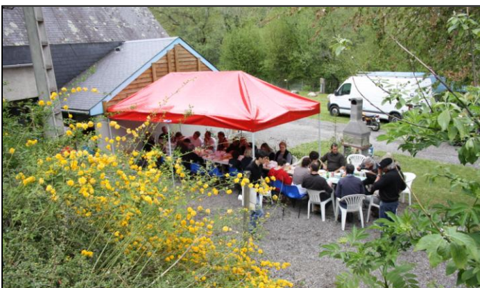
Ce qui n'empêche pas les autres d'arroser la 1 ère virée.