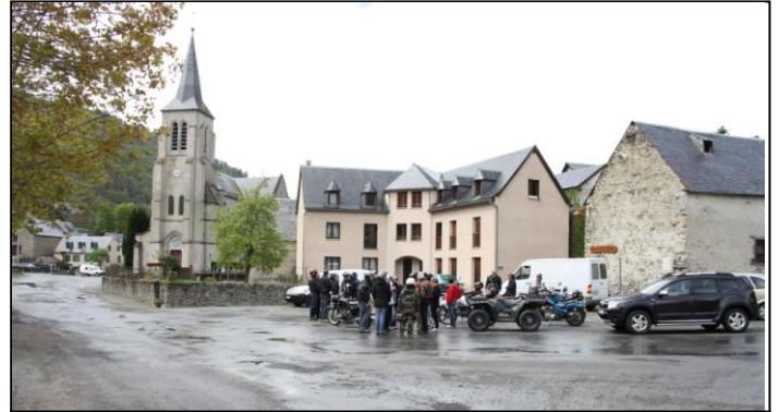
Puis descente dans la vallée, à BORDÈRES-LOURON 159 hab. et 9hab/km 2 . Regroupement sur la petite place.