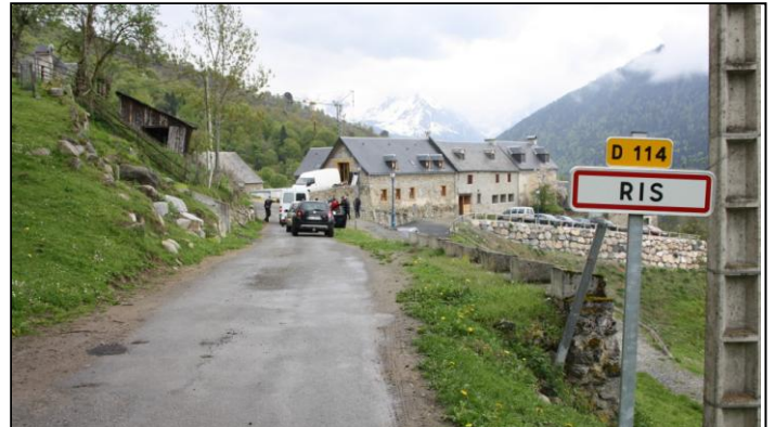
Dans l'après-midi, nouvelle virée qui nous amène dans une série policière. RIS : altitude 1100m et 12 hab. sur 2km 2 .