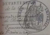
TABLE DECENNALE des actes de Mariage

de la commune de S t -André de Cubzac du 1 er Janvier 1853 au 31 Décembre 1862 dressée en exécution du décret du 20 Juillet 1861 (1853 à 1862)