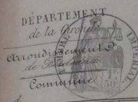
TABLE DÉCENNALE des actes de Mariage de la commune de S t -André-de-Lubzac du 1 er Janvier 1853 au 31 Décembre 1862 dressée en exécution du décret du 20 Juillet 1807 (1853 à 1862)